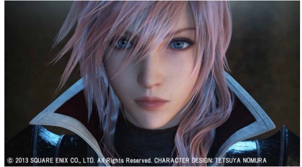
© 2013 SQUARE ENIX CO., LTD. All Rights Reserved. CHARACTER DESIGN: TETSUYA NOMURA