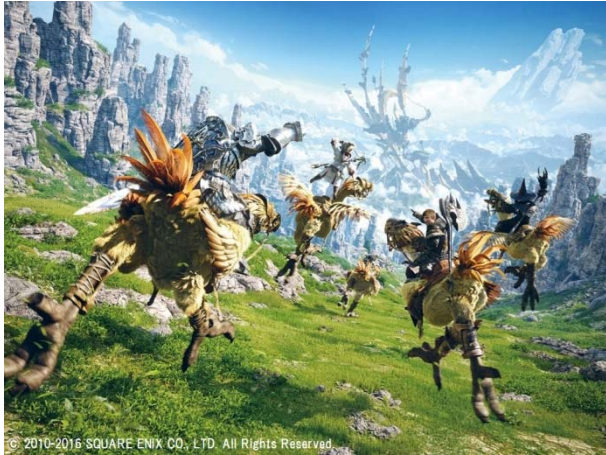
「ファイナルファンタジーXIV: 新生エオルゼア」より