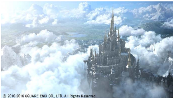
「ファイナルファンタジーXIV: 蒼天のイシュガルド」より